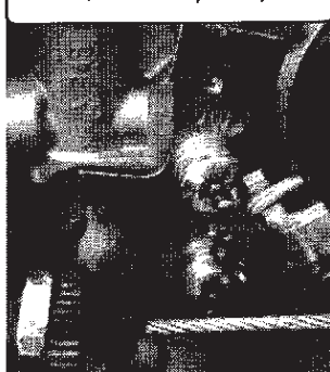
סימון הספק - בית מצרת